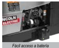
Fácil acceso a batería