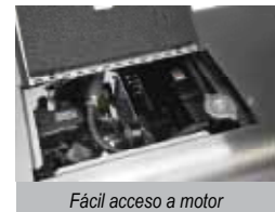
Fácil acceso a motor

El Ranger® 305D CE es un potente generador autónomo de soldadura multiproceso para corriente continua DC de hasta 300A, diseñado especialmente para aplicaciones en campo abierto, en las que es vital el disponer de las mejores características de soldadura, combinadas con las máximas potencia y robustez del equipo.