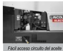
Fácil acceso circuito del aceite