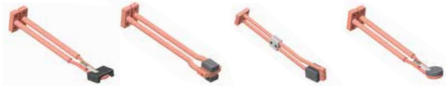
Bobina de enfoque