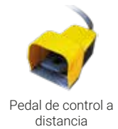
Pedal de control a distancia