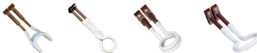
Bobina de perfil "U"