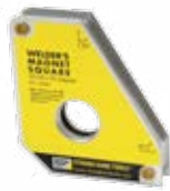
MS60 60°, 90°