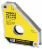
MS45 45°, 90°